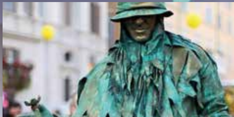
BENNI GREEN (Italia)