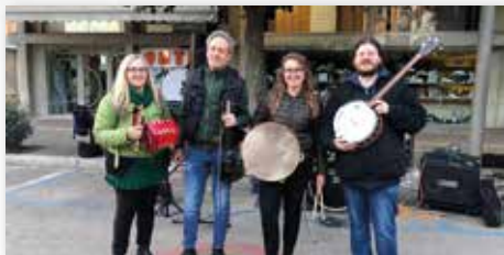
GRUPPO STRUMENTALE ARS ANTIQUA (Italia)

Ciò che i visitatori credono di vedere in questa statua vivente può essere ingannevole! Si tratta di uno spirito o gnomo della foresta? Il personaggio è tutto ciò che il pubblico vede o vuole vedere in lei.